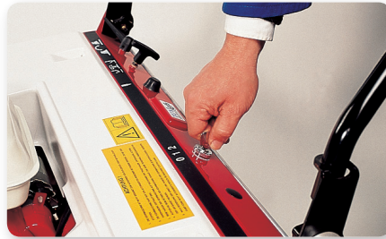
Scuotitore elettrico Electric filter shaker Sacudidor de filtro eléctrico