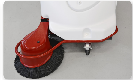
Paraurti Bumper Parachoques