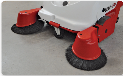
Braccio spazzola laterale sinistro Left side brush arm Brazo lateral izquierda